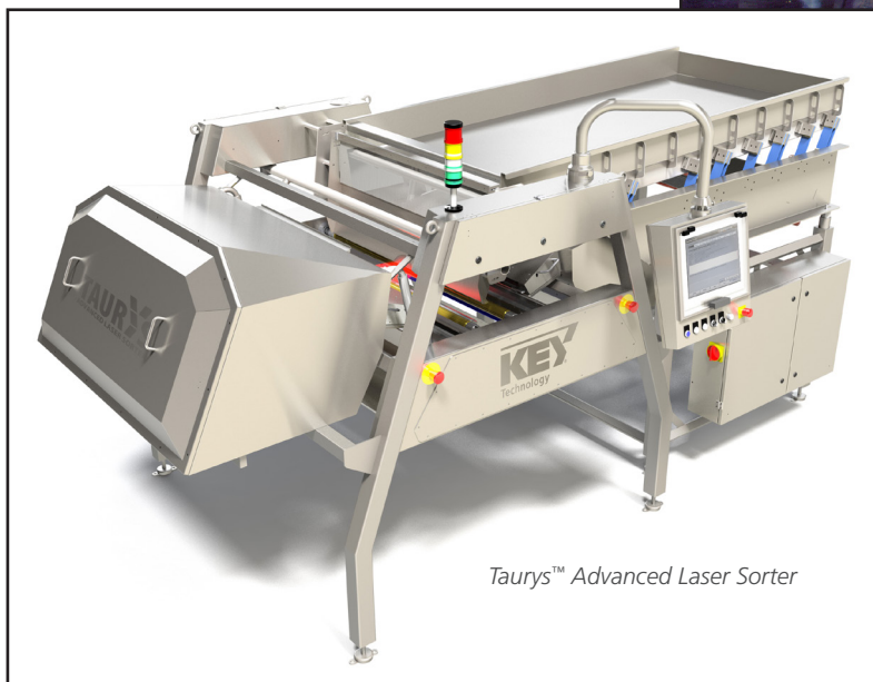
Taurys™ Advanced Laser Sorter

Las soluciones de clasificación alimentadas por conducto de Key son ideales para la verificación final de material extraño y de calidad de los vegetales congelados antes del empaque.