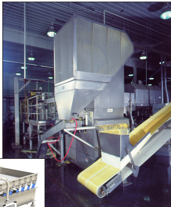
Limpiadora Hi-Flo Air Cleaner