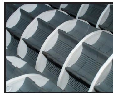
Bolsillos del clasificador de tamaño giratorio