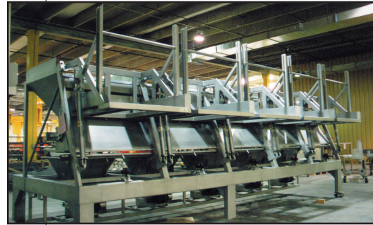
Volteador de recipientes

Este equipo puede ser utilizado para otras aplicaciones. Comuníquese con Key para saber cómo sus productos pueden beneficiarse de esta u otra tecnología.