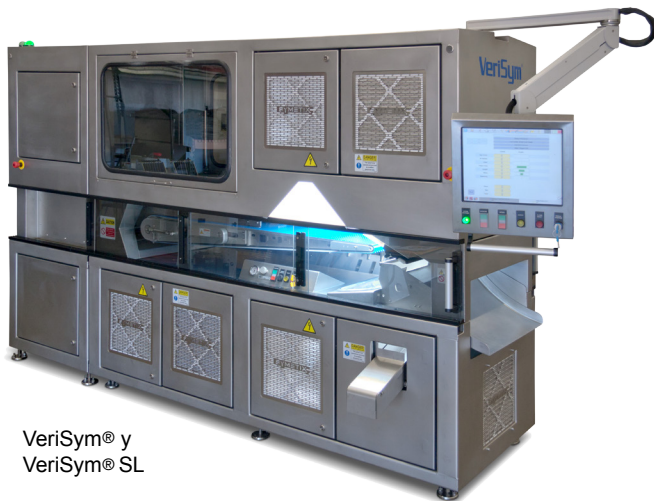
VeriSym® y VeriSym® SL