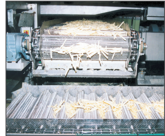
Tapis transporteur en maillage métallique