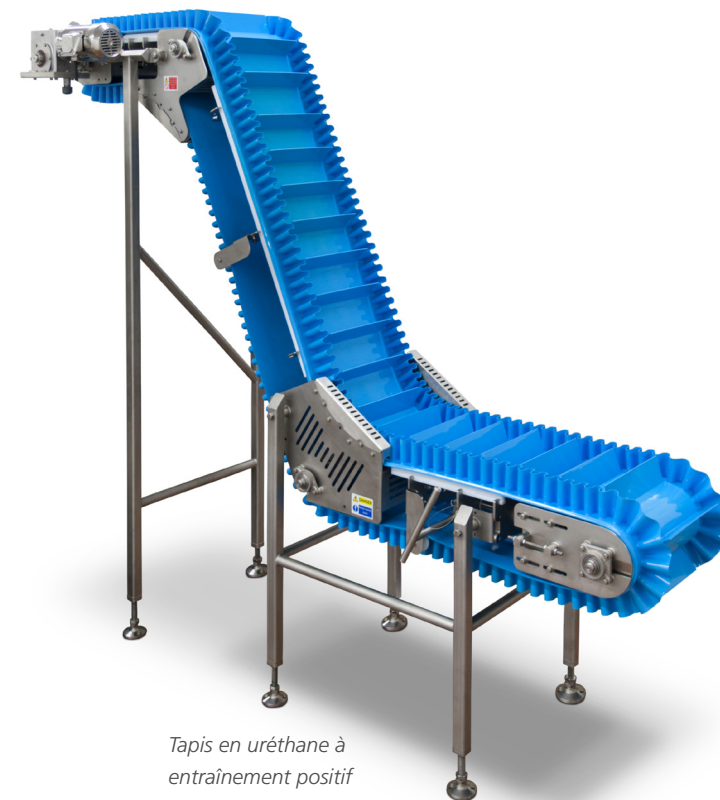
Tapis en uréthane à entraînement positif